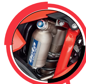
MONOSHOCK KAYABA C46 RCU