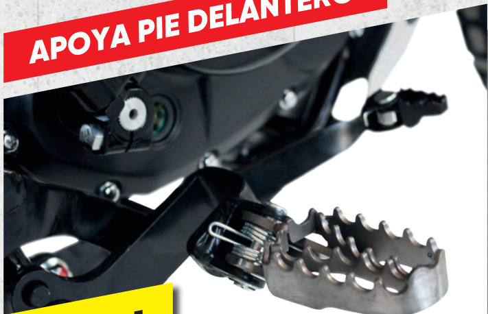
APOYA PIE DELANTERO