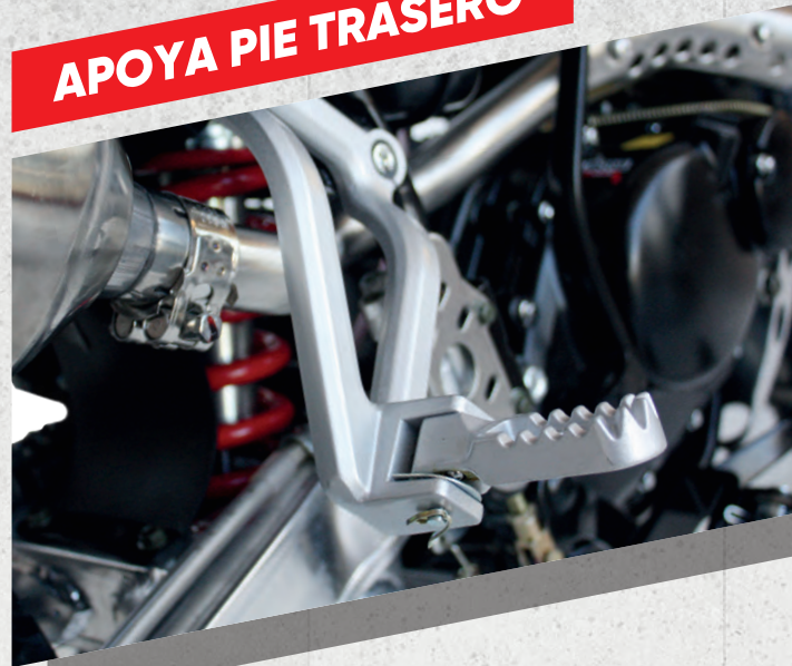
APOYA PIE TRASERO