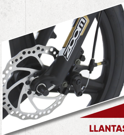
LLANTAS De aleación.