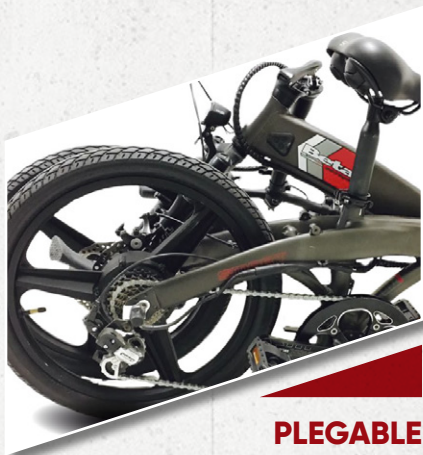
PLEGABLE Práctica y liviana.