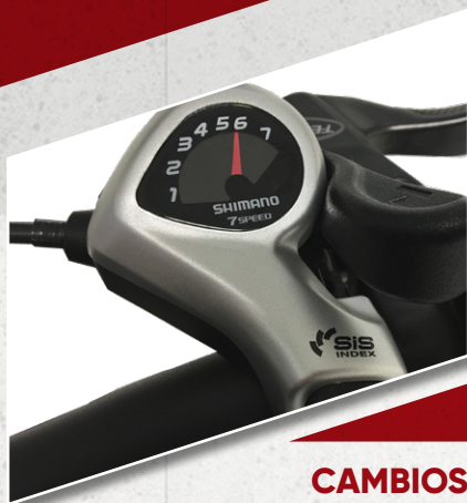
CAMBIOS Shimano de 7 velocidades.