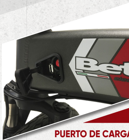
PUERTO DE CARGA Carga completa de batería en 5 horas.