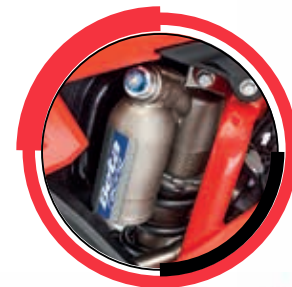
MONOSHOCK KAYABA C46 RCU